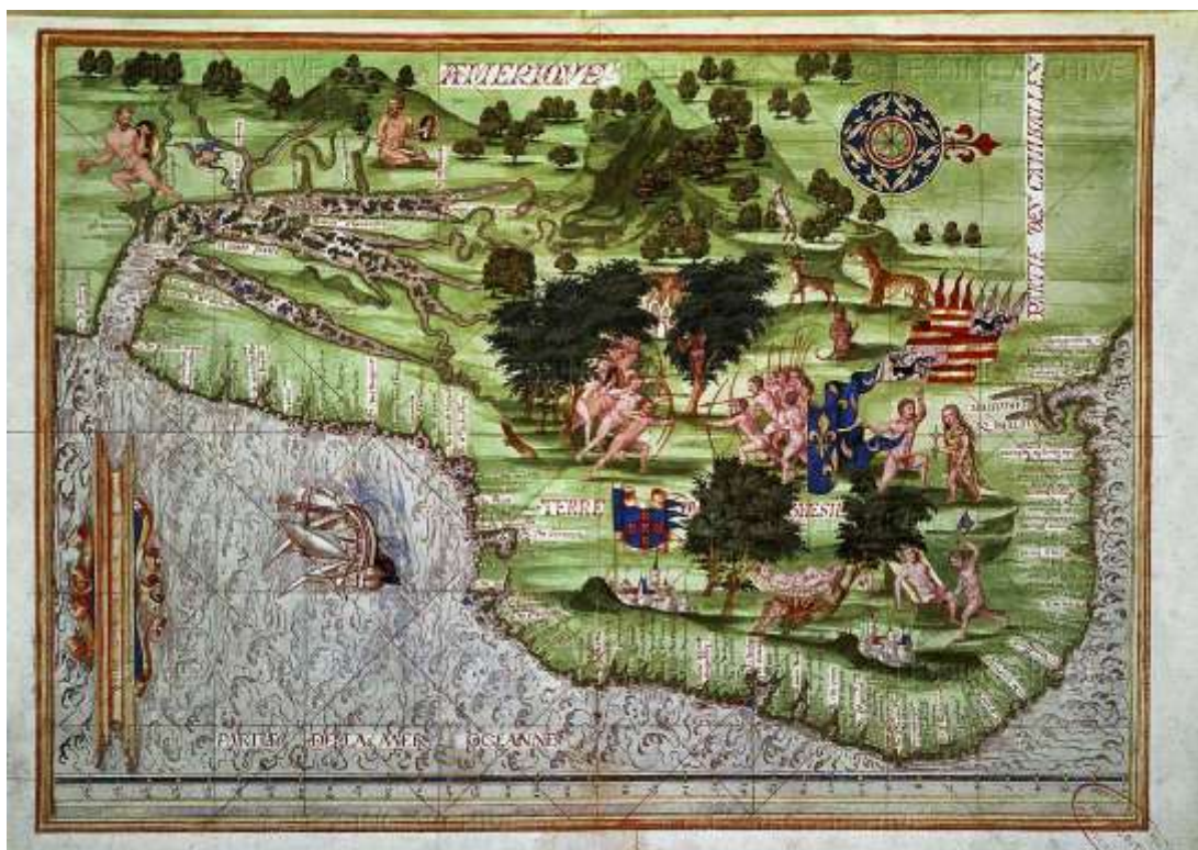
Guillaume Le Testu – “Cosmografia universal” – 1556.

Qual seria sua função? Espantar o frio, afastar animais perigosos e dissipar espíritos maus são algumas das justificativas levantadas por Câmara Cascudo. De todo modo, é interessante perceber a solução dada por Le Testu: havendo fogo abaixo desses corpos, porque não transformar a fogueira em uma arcaica cozinha? Uma perna torra ao lado do fogo, ao passo que homem e mulher dormem. À direita, outra figura indígena porta um machado e dá prosseguimento ao despedaçar de um corpo. Este tipo de iconografia lembra a associação, desde a Idade Média, entre três dos pecados capitais, ou seja, a preguiça, a gula e a luxúria, como relacionados por João Cassiano no que diz respeito à relação com o corpo e os prazeres da carne. 6 Deste modo, o europeu do Renascimento conseguia reunir em uma composição três dos elementos que mais impressionavam no novo mundo: a cama indígena, a rede e seu elogio à preguiça; a ausência de vestuário e o apelo à visualização da nudez dos corpos; o canibalismo encontrado em algumas tribos e recebido como primitivismo e selvageria.