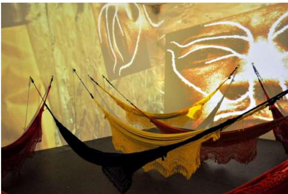
Hélio Oiticica – “Cosmococa 5 Hendrix War” – 1973.