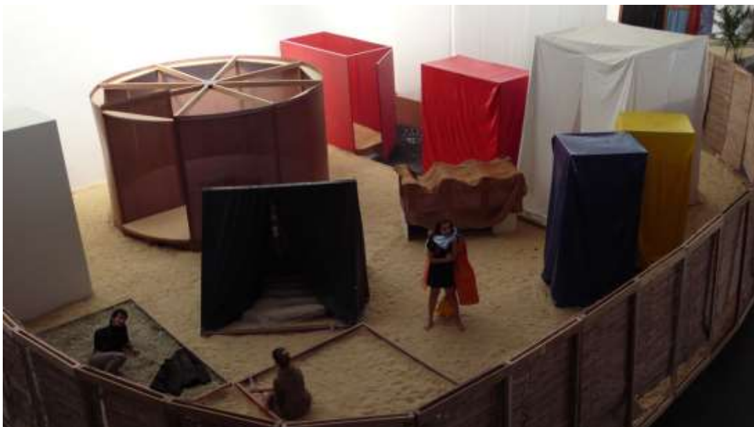
Hélio Oiticica – “Éden” – 1969.