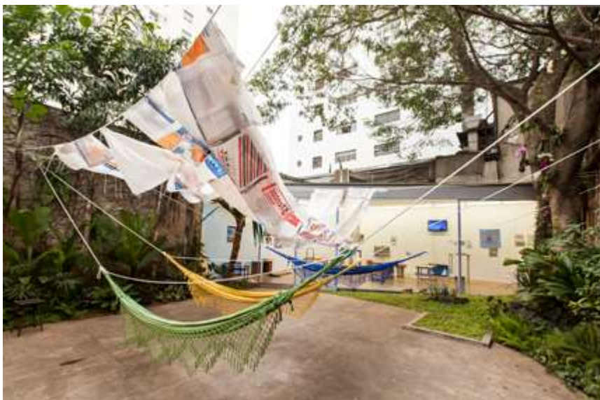
Paulo Nazareth – “Notícias de América”, na galeria Mendes Wood, em São Paulo – 2012.