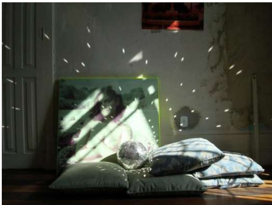
Orlando Maneschy – sem título – 2008.