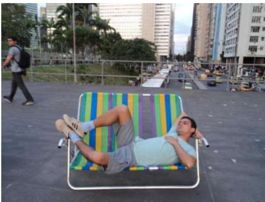
Opavivará! – “A rua é um espetáculo” – 2011.