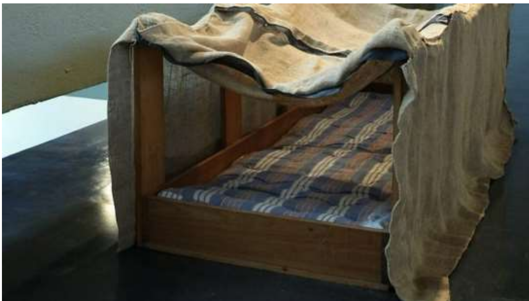
Hélio Oiticica – “Cama-bólido” – 1967.

Em 1967, o artista desenvolve um novo objeto intitulado “Cama-bólido”. Feito de velhos pedaços de madeira, um colchão velho e um lençol, foi construído não apenas para ser visto, mas também para ser integrado ao corpo do até então espectador. O público, portanto, era convidado a entrar nessa, tocar sua textura e ali passar o tempo que desejasse dormindo dentro dessa estrutura. Nos dois anos seguintes, Oiticica desenvolveu um novo conceito artístico chamado “crelazer”; a palavra é uma fusão de outras duas: “criação” e “lazer”. Ele disse não se tratar do “... lazer repressivo, dessublimatório, mas o lazer usado como ativante não repressivo, como crelazer”. Nesse sentido,