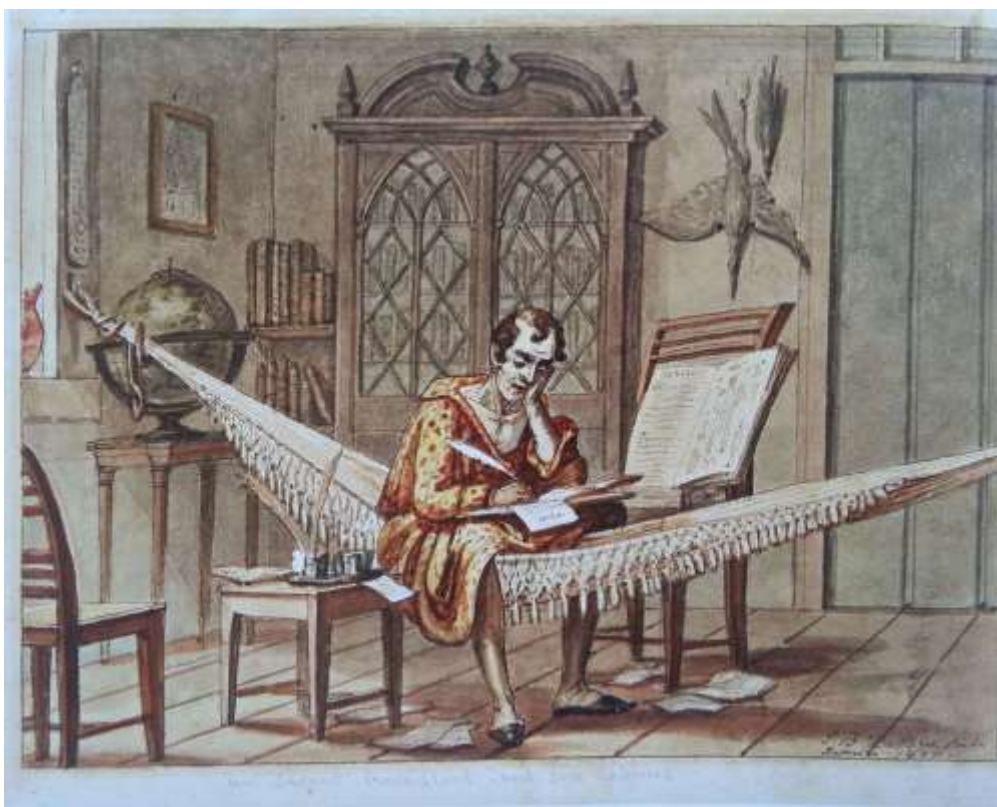
Jean-Baptiste Debret – “Sábio trabalhando em seu gabinete” – 1827.

Ao centro da imagem, a figura de um homem cabisbaixo e com uma pena na mão. Sobre suas coxas, uma superfície de madeira e uma série de papéis. Ao chão, ao lado de seus pés, mais papéis parecem ter caído. Ele traça uma estranha vestimenta ao olhar contemporâneo e que Debret irá descrever, em outra aquarela, por “roupão de chita”. Eis o nosso sábio de chinélos. À sua direita, sobre um banco de madeira, mais penas, tinteiros e papel. À sua esquerda, um caderno com anotações e esboços repousa sobre uma cadeira. À direita da imagem, dois pássaros mortos e uma porta de madeira que denota que o homem se encontra encerrado dentro do que pode vir a ser um quarto. Atrás dele, fileiras de livros organizados e resguardados dentro de um móvel. À esquerda da imagem, um pequeno retrato emoldurado, um globo terrestre e um termômetro. O sol ilumina esta cena através de uma janela aberta à esquerda; uma cadeira vazia é mostrada ao espectador. Eis o gabinete de trabalho deste sábio e que é cortado de ponta a ponta por um elemento que salta aos olhos e se configurará como essencial nesta leitura: uma rede.