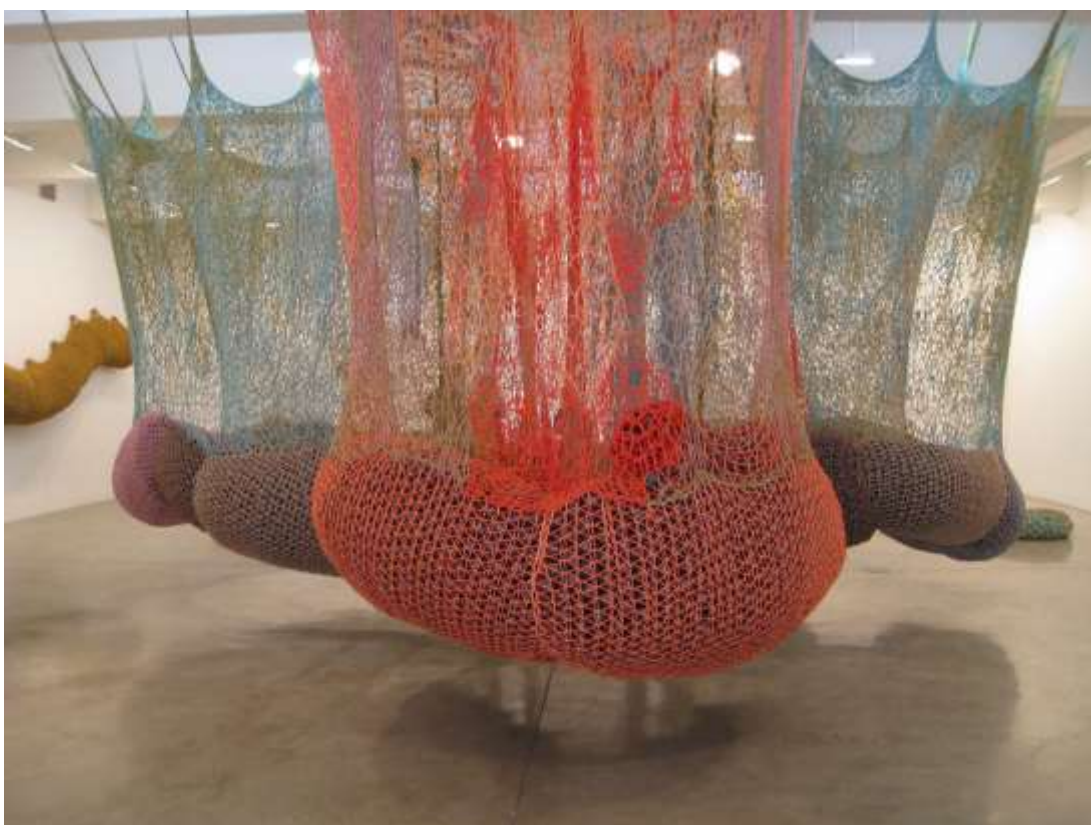
Ernesto Neto – “O pássaro da ilha” – 2012.

Se em 1969, no “Éden”, realizado na Whitechapel Gallery, em Londres, o espectador experimentava o repouso através da estesia de se fruir um leque de diferentes materiais como areia, palha e água, em 1973, na “Cosmococa 5 Hendrix War”, em co-autoria com Neville D’Almeida, lá está a nossa rede de dormir. Nosso corpo é convidado ao balanço e, diferente do sábio visto pelos olhos de Debret, incapaz de trabalhar de modo cientificista nos trópicos, somos levados a uma letargia do cubo branco passível de associação com o momento posterior ao uso da cocaína.