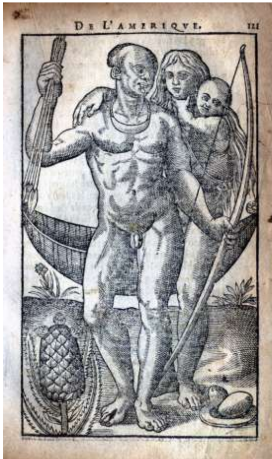
Jean de Lery – gravura de “História de uma viagem feita à Terra do Brasil, também dita América” – 1578.