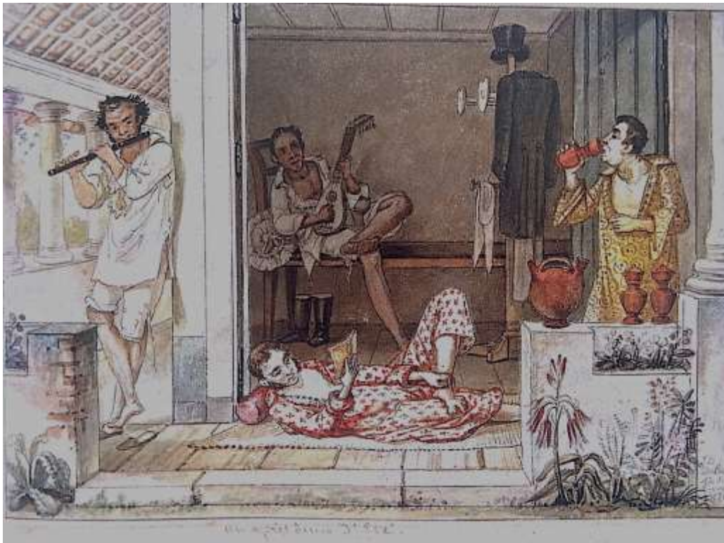
Jean-Baptiste Debret – “Uma tarde de verão” – 1826.

haverá a representação do homem branco próximo ou deitado nela tal qual mostra Debret.