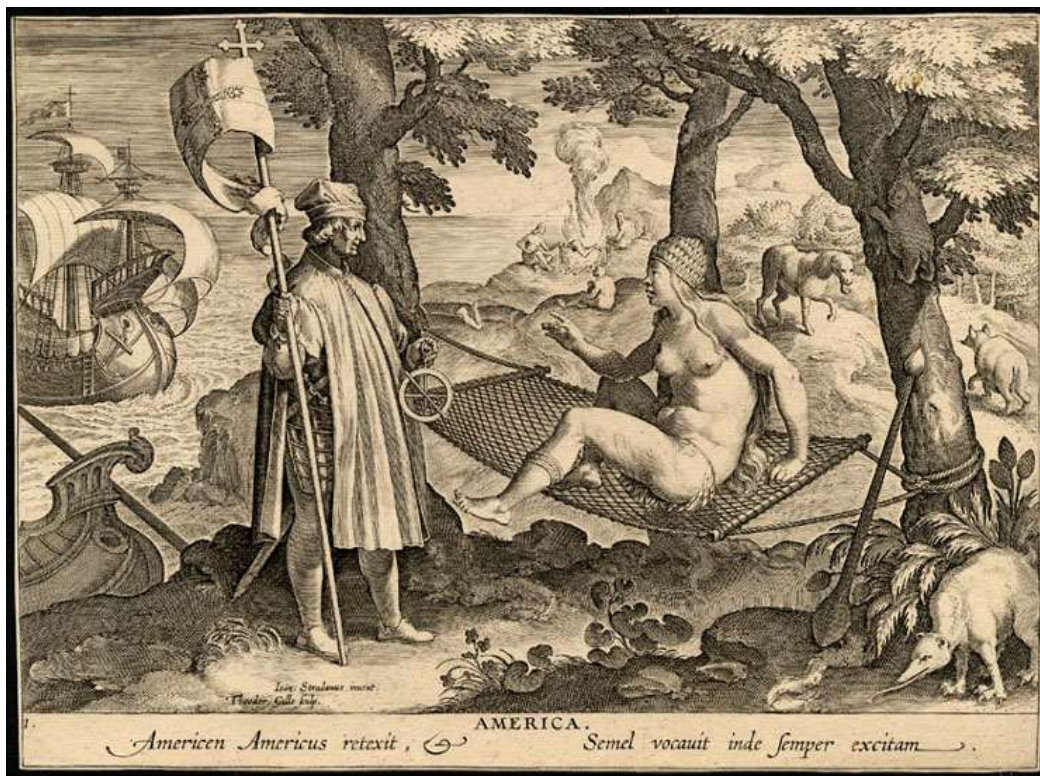
Theodor de Galle – “Américo redescobre a América; ele a chamou uma vez e desde então ela permanece acordada” – 1630.

Outro exemplo, da virada do século XVI para o XVII, datada em 1587, amplia a alegoria da rede do Brasil para o continente americano. Jan van der Straet, ou como geralmente é referido, Stradanus, artista flamenco, realiza um desenho da chegada de Amerigo Vesputio ao Novo Mundo. A alegoria da América se dá através do corpo de uma índia que repousa sobre uma rede. Ao fundo, novamente, uma cena de canibalismo em torno de uma fogueira. A caravela, a cruz e o instrumento utilizado para navegação por Vesputio dão o tom do contraste entre civilização e selvageria. Theodor de Galle, gravurista flamenco, irá transformar o desenho em gravura, em 1630 e completar com uma frase abaixo: “Américo redescobre a América; ele a chamou uma vez e desde então ela permanece acordada”. A América, assim como o hino da nação brasileira diz, estava “deitada eternamente em berço esplêndido”; preguiçando sobre a rede de dormir, se fazia necessário que um homem de exceção como Vesputio a despertasse.