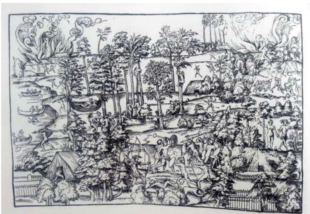
Autor anônimo – “Fête brésilienne” – 1551.

Desde o “descobrimento” do Brasil, as redes indígenas se configuraram como o principal meio de repouso e sono dos habitantes da colônia. Um número extenso de viajantes dedicou linhas a este fato: André Thevet, Jean de Lery, Hans Staden, Jean Nieuhof e Karl von den Steinen, apenas para citar alguns. O objeto causava estranhamento e gerava debate. Por que os índios o criaram? Por que não deitar sobre uma superfície mais rígida, tal qual uma cama? As interpretações mais comuns, segundo a compilação feita por Câmara Cascudo, eram de que o seu entrelaçado impedia que alguns insetos picassem os índios.